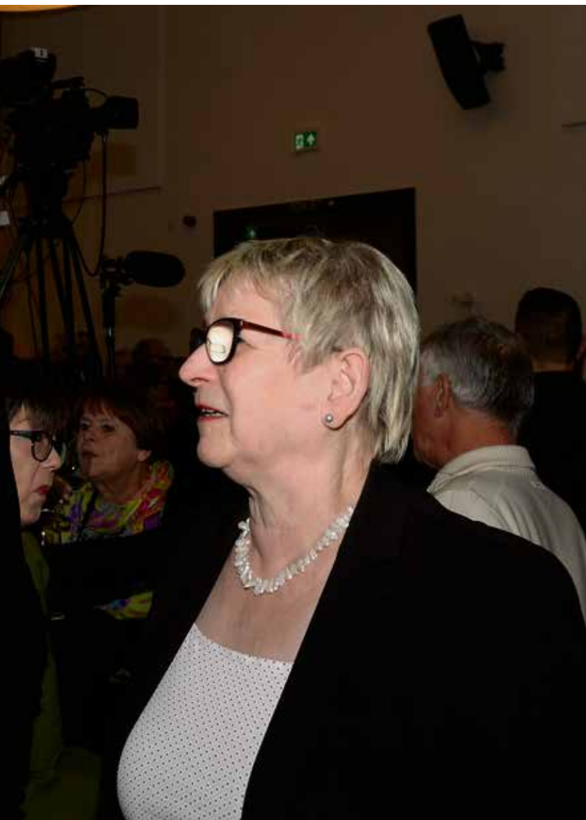
hebben een onderonsje tijdens de uitslagenavond in 't Gemeinsjapshoes in Schimmert.

te vormen gemeenteraad een vertrouwenscommissie moeten samenstellen, waarna de procedure voor een nieuwe burgemeester voor de komende zes jaar kan beginnen. Maar zoals gezegd: eerst moet die waarnemer er komen, dat is al werk genoeg.'